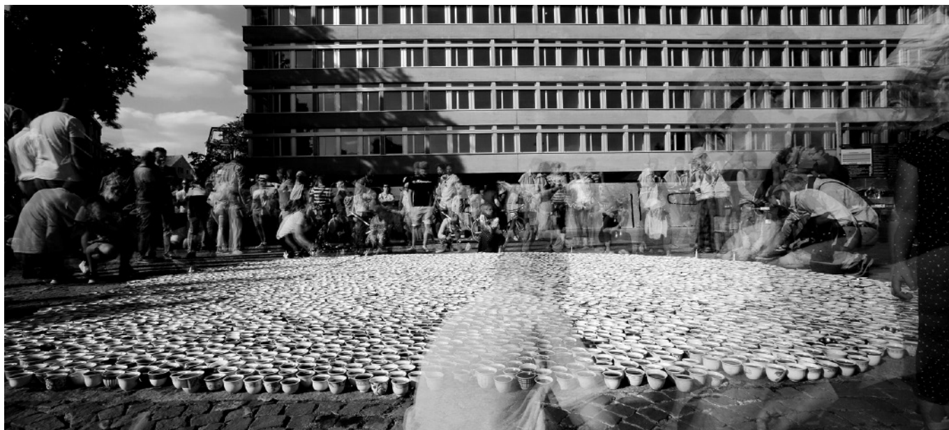
Nomadski spomenik ŠTO TE NEMA 11. jula 2018. u Cirihi, Švicarska.