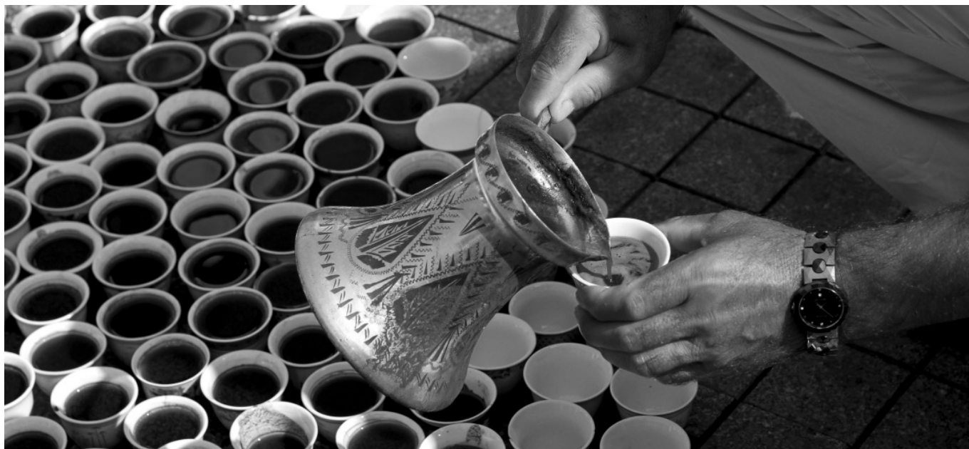
Nomadski spomenik ŠTO TE NEMA 11. jula 2012. u Istanbulu, Turska.

Arhiva spomenika Spatium Memoriae [ŠTO TE NEMA] je nastajala sumiranjem različitih muzejskih funkcija. Proces prikupljanja fildžana ima važnu ulogu u životu spomenika: osnovu su poklonile članice udruženja „Žene Srebrenice“, dok je ostatak fildžana prikupljen uključivanjem ljudi iz svih dijelova svijeta. Nakon prikupljenih 8.372 fildžana, proces prikupljanja nije stao jer je u društvu i dalje postojala potreba za učešćem u izgradnji spomenika. Konotativno, svaki „fildžan viška“ ukazuje na povezanost šire društvene zajednice sa žrtvama genocida, ukazujući i na stradanja onih koji su ubijeni u vremenu opsade Srebrenice od 1992. do 1995. Nadalje, društvena zajednica kroz performans učestvuje u procesu „arhiviranja“ fildžana u policu koja po svom dizajnu podsjeća na forenzičke, ali i muzejske arhive. Umjetnica u utišanom muzejskom prostoru publici daje priliku za lična i kolektivna propitivanja historije, savremenosti, odnosa prema žrtvama, o nama danas, o onome što ostavljamo onima što će sutra doći. Pitanja koja provocira živi spomenik uspomenama potvrđuju nemogućnost čovjeka i muzejske struke da ponudi brze historiografske odgovore. Moramo se kontinuirano sjećati.