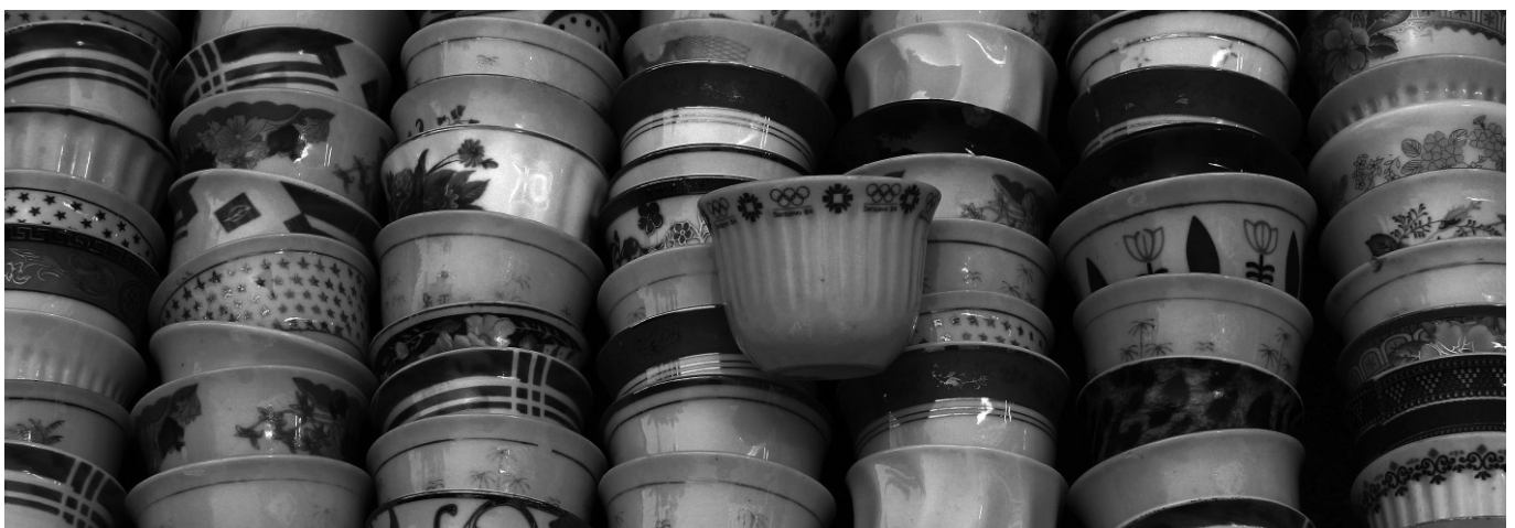
Nomadski spomenik ŠTO TE NEMA 11. jula 2015. u Ženevi, Švicarska.

The incomplete archive was first presented at the 58th Venice Biennale as part of the ARTIVISM exhibition organized by the Auschwitz Institute for the Prevention of Genocide and Mass Atrocities. It was presented at the Canadian Museum for Human Rights in Winnipeg and the Laumeier Sculpture Park in St. Louis in 2021.